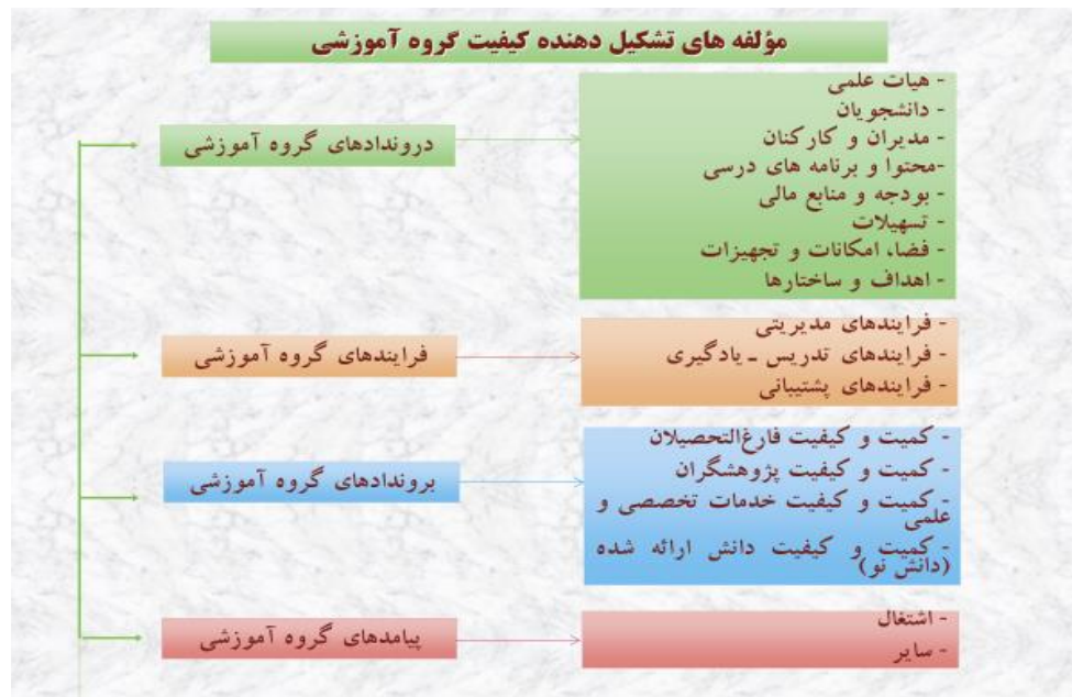
نمودار (۲) بیان‌گر عوامل مورد ارزیابی در گروه آموزشی

درون‌داد، فرایند، برون‌داد و پیامد تقسیم‌بندی کرد. نمودار شماره ۲، بیان‌گر مؤلفه‌های تشکیل دهنده کیفیت گروه آموزشی است. پس از تعیین عوامل مورد ارزیابی، لازم است اجزای هر عامل تدوین شود. برای نمونه اگر کمیته‌ی ارزیابی گروه آموزشی فیزیک در دانشکده‌ی علوم، «تدریس و آموزش» را به‌عنوان یک عامل مورد ارزیابی در نظر گرفته باشد، اجزای این عامل می‌تواند شامل موارد زیر باشد: کیفیت تدریس، ارتباط بین فردی، استفاده از فناوری اطلاعات و ارتباطات ارزشیابی درس.